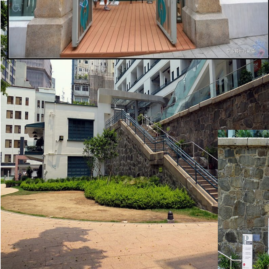
中央書院的石級與石牆