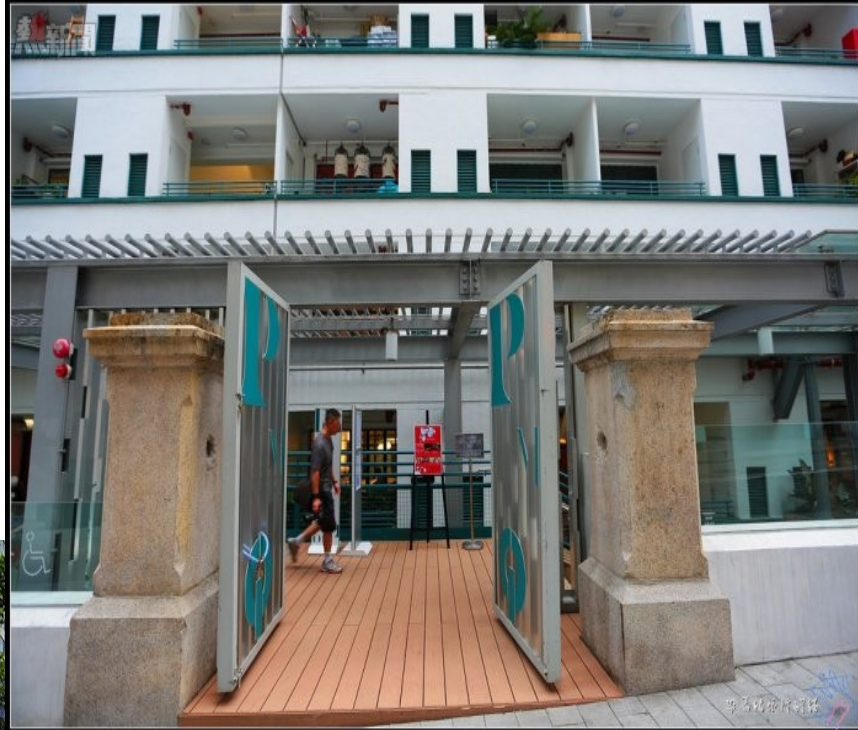
前荷李活道已婚警察宿舍正門